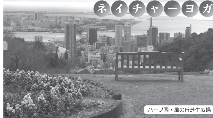
ハーブ園・風の丘芝生広場